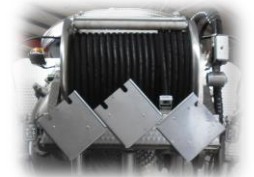
Pannello di controllo