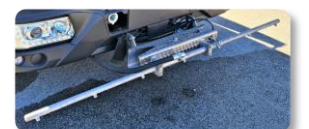
Barra lavastrade mobile anteriore