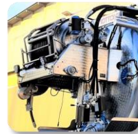
Naspo fisso posteriore